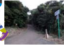
志々伎神社の駐車場まで(スタート地点2)車で上れます。