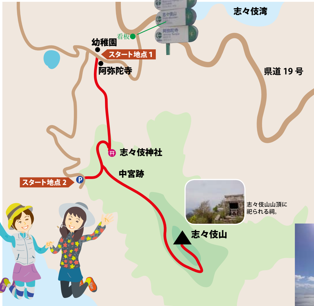
志々伎神社への参道の石段を登ると左手に中宮跡