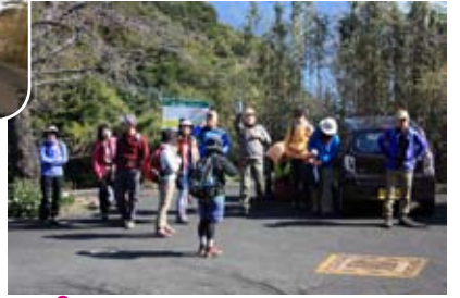
阿弥陀寺前でストレッチ！ (スタート地点1)