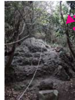
途中からロープ場の連続です。