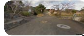
阿弥陀寺への道を登ると広場が。