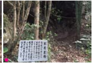
草履置き場。かつては女人禁制の山だった。