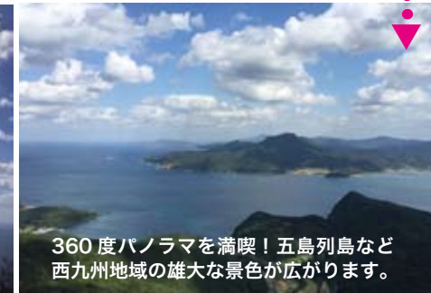
360度パノラマを満喫！五島列島など西九州地域の雄大な景色が広がります。