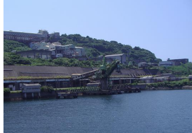
▲池島港より 石炭積み込み機など