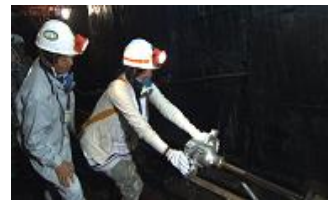
▲穿孔(せんこう)機械操作体験