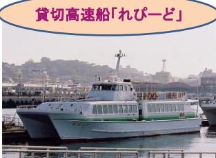
貸切高速船「れびーど」