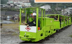
▲トロッコ電車(片道300m乗車)