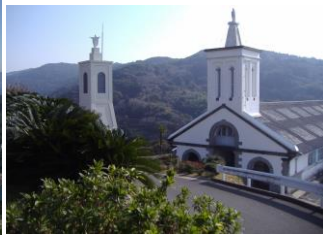
▲出津文化村「出津(しつ)教会」 明治15年・ド・ロ神父の設計施行で建てられた教会で周辺には、ド・ロ神父記念館などもあります。 (注)行事により教会内に立入できない場合もあり