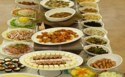
▲レストラン ラ・メールバイキング