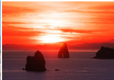
▲外海サンセットクルーズ