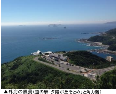
▲外海の風景(道の駅「夕陽が丘そとめ」と角力灘)