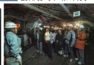
▲トロッコ下車後は元炭鉱マンがご案内